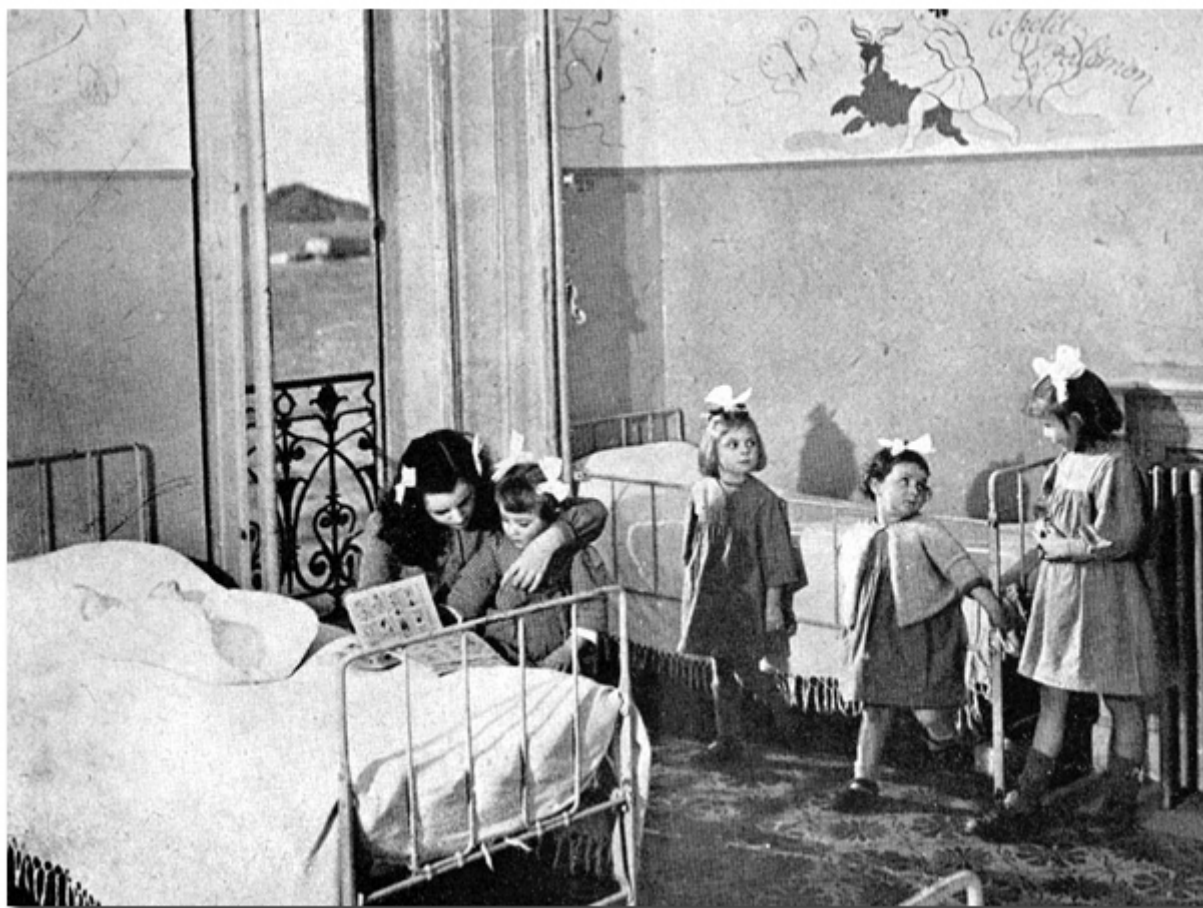
Chambre de malades