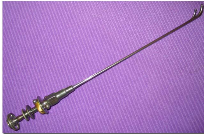
Brise pierre de Civiale

La maladie dite de la « pierre » était due à un ou plusieurs calculs qui stagnaient dans la vessie et qui y grossissaient. On utilisait un appareil qui s'appelait un « lithotriteur » ou « lithotribe » qui était introduit par les voies naturelles et par tâtonnement le chirurgien bloquait la pierre contre les mors. En actionnant la vis, les mors se rapprochaient l'un de l'autre et brisaient ainsi le calcul. L'opération était répétée autant de fois qu'il le fallait pour que les débris ainsi obtenus puissent être évacués naturellement.