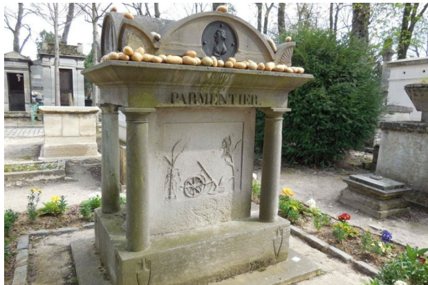
Tombeau de Parmentier au Père Lachaise

Estimé mais peu aimé des Rois, des dirigeants et de l'Empereur, il connaît une gloire posthume qu'il méritait mais n'avait jamais recherchée : chaque année en décembre pour l'anniversaire de sa mort, des anonymes déposent des pommes de terre sur sa tombe au cimetière du Père-Lachaise.