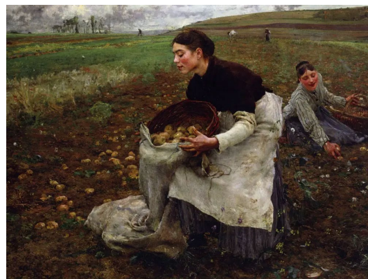
La récolte de pommes de terre

Parmentier est devenu pour les français la légende de la pomme de terre. En fait il ne mérite pas ces honneurs. La patate est arrivée en Espagne au milieu du XVIème siècle (patatas) et en Angleterre (potatoes) au début du XVIIème siècle, provenant d'Amérique. Ce légume est très largement utilisé dans toute l'Europe au XVIIème siècle. En France, elle est considérée comme impropre à la consommation humaine, provoquant des maladies comme la lèpre, juste bonne pour donner à manger aux cochons. Aussi depuis 1748 le Parlement en interdit l'usage, et la nourriture essentielle des français c'est le pain. Parmentier qui s'est nourri de pomme de terre lors de son séjour en Prusse a observé que tous ceux qui en consommaient n'étaient pas incommodés et que sa culture était possible