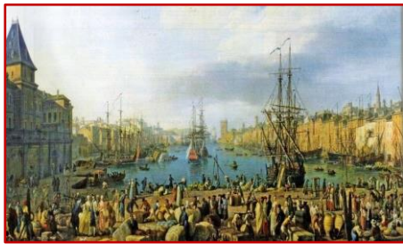
Joseph Vernet 1754

Le café a été introduit pour la première fois en France par un négociant marseillais en 1644. Face au rapide développement de sa consommation dans presque toutes les couches sociales de la ville mais aussi des environs, en particulier à partir des années 1660 où son importation et son commerce étaient devenus monnaie courante, le corps médical marseillais s' alarma. Considérant que le café, qu'il considérait comme sa chose - à savoir une sorte de médicament - échappait à sa prescription pour devenir un outil de convivialité et déjà presque un phénomène de société, le corps des médecins de Marseille décida de lui porter un coup d'arrêt en instruisant son procès à charge avec beaucoup de mauvaise foi. Ce procès du café est rapporté comme le premier débat