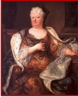
La Princesse Palatine

Ou, mieux encore, celle trouvée dans la correspondance de la Princesse Palatine, belle-sœur de Louis XIV, perle parmi tant d'autres : « Je regrette d'apprendre que vous vous êtes habituée au café; rien au monde n'est plus malsain. Je vois tous les jours des gens qui ont été forcés d'y renoncer, à cause des grandes maladies qu'il a causées. La princesse de Hanau en est morte après d'horribles souffrances. On a trouvé après sa mort que le café avait causé dans son estomac une centaine de petits ulcères. Que cela vous serve de leçon. »